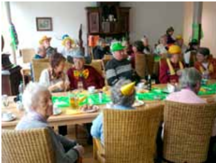
KARNEVALSSTIMMUNG MIT KUCHEN & KAFFEE