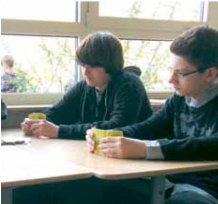
DOPPELKOPF - SPAß IN DER PAUSE

Ergänzt wird die Freizeitgestaltung durch kreativ-künstlerische Angebote. Diese ergänzen sinnvoll die Gestaltung von Schule als Lebens- und Erfahrungsraum, in dem die Kinder und Jugendlichen ihren Neigungen und Interessen nachgehen können.