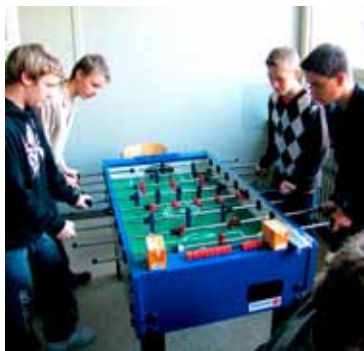
BANANENFLANKEN AM KICKER - BIS ES SCHELLT

Ziel des Förderunterrichts ist es, die Schüler/-innen bei der Bewältigung der Leistungsanforderungen zu unterstützen und Defizite aufzuarbeiten. Der Förderunterricht wird für alle Kernfächer angeboten und von geeigneten Oberstufenschülern sowie von Fachlehrern durchgeführt.