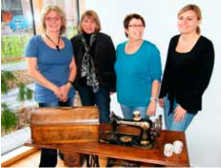
DAS TEAM DER TAGESPFLEGE