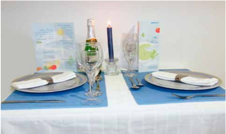
FOTO: DER MENÜTISCH IM HAUS DER DIAKONIE