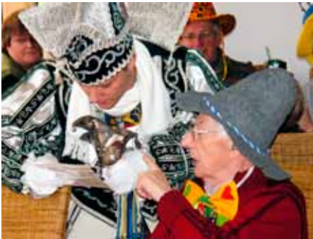
PRINZ CHRISTIAN I. BEI DER LEKTÜRE

Eine gute Figur machte das Gocher Prinzenpaar in der Session 2009/2010. So besuchten sie gut gelaunt die Tagespflege und ließen jecke Herzen bei Tagespflegegästen und Angehörigen höher schlagen. Die Fotostrecke zeigt einige Eindrücke.