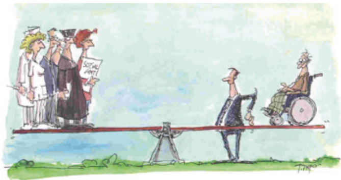
KARIKATUR: THOMAS PLASSMANN (C) DIAKONISCHE WERKE BADEN UND WÜRTTEMBERG

Die Bestellung des Verfahrenspflegers endet mit der Rechtskraft des Verfahrens, für das er bestellt ist, beispielsweise, wenn der Unterbringungsbeschluss genehmigt wurde und die Frist zur Einlegung von Rechtsmitteln abgelaufen ist.