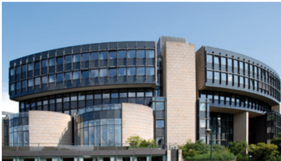
DER LANDTAG DES LANDES NORDRHEIN-WESTFALEN