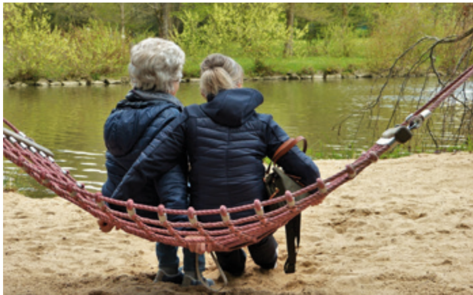
OB ANGEHÖRIGE/-R ODER FREMDE/-R – DIE CHEMIE ZWISCHEN BETREUER UND BETREUTER PERSON IST WICHTIG.