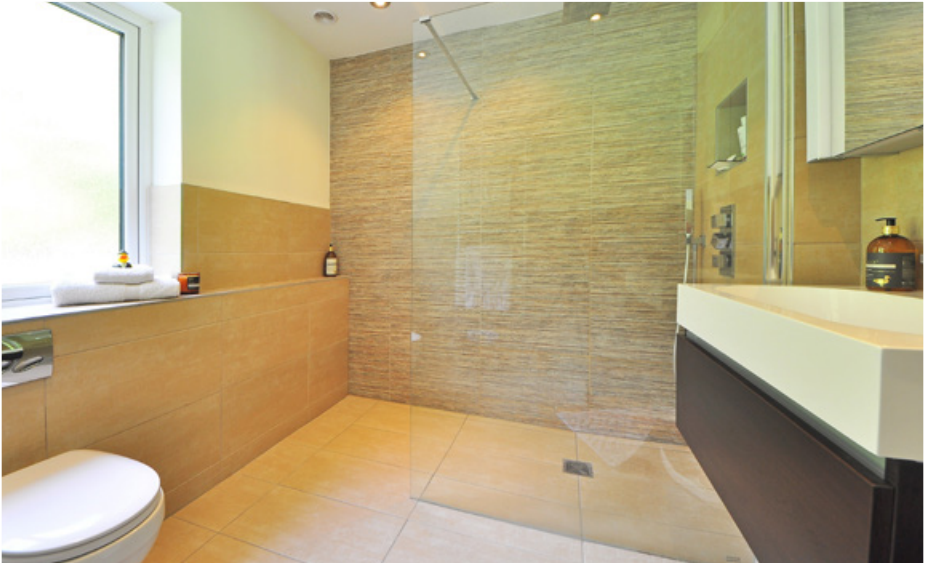
Eine begehbbare Dusche ist für Senioren mit eingeschränkter Beweglichkeit ist eine feine Sache.