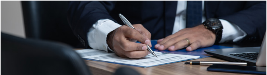
VOR DER UNTERSCHRIFT STEHT DIE FRAGE, OB DIE AUSSCHLAGUNG DEM WOHL DES BETREUTEN ENTSPRICHT.

einer nachgewiesenen Überschuldung des Nachlasses abhängig.