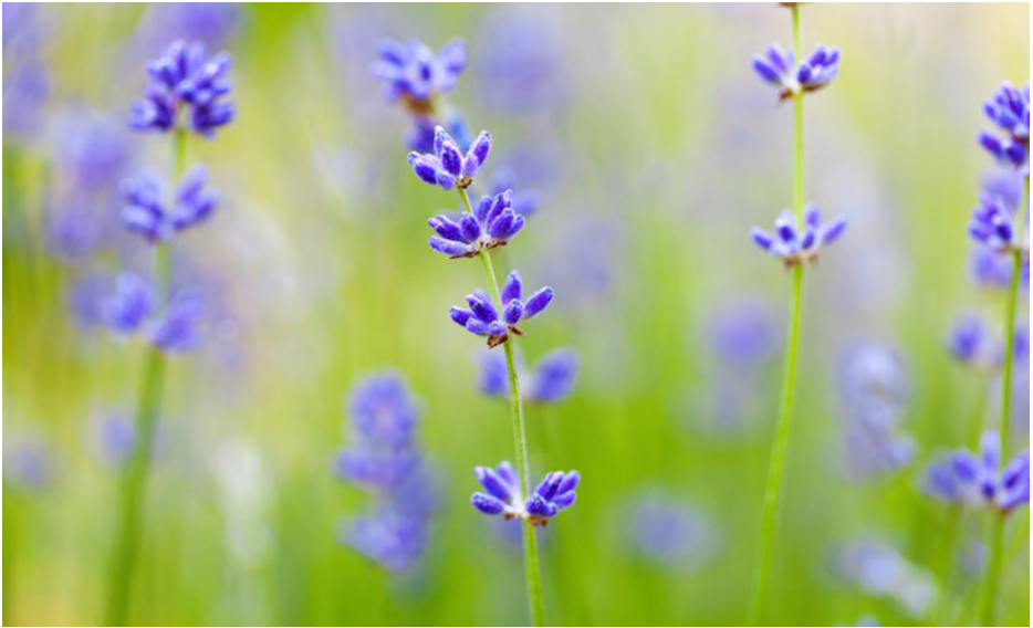
NEBEN BLINDEN MENSCHEN GIBT ES AUCH EINE VIELZAHL SCHWACH SEHENDER MENSCHEN.

das Langstocktraining. Langstocktraining ermöglicht blinden Menschen Orientierung. Ist aber das Langstocktraining erfolgreich beendet, endet diese Eingliederungshilfe.