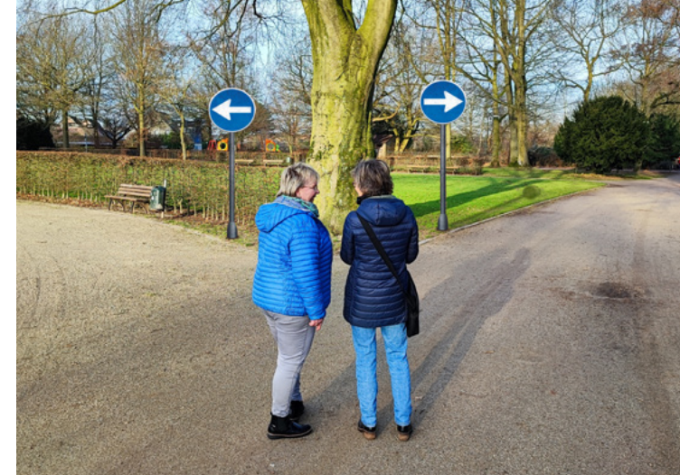
Betreuer*innen unterstützen die Entscheidungsfindung.

Wenn Sie eine rechtliche Betreuung übernehmen möchten oder bereits eine Betreuung führen, sprechen Sie uns gerne an.